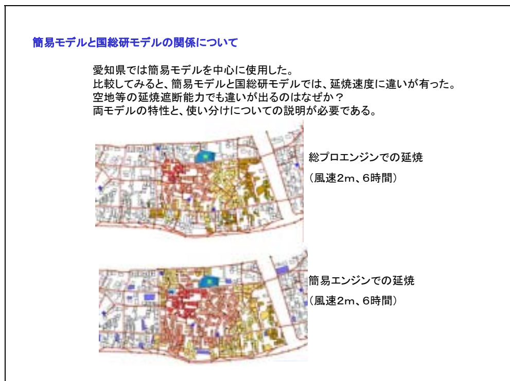
図 3.2.1 簡易型モデルと国総研モデルによるシミュレーション結果の違い